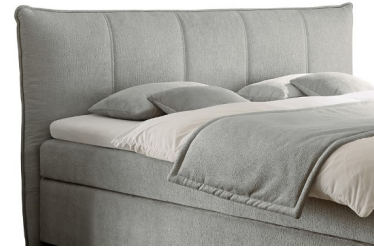
Kopfteil 3 (kürzbar) Stellmaßlänge ca. 210 cm Stellmaßbreite ca. Liegefl. + 20 cm Kopfteilhöhe ca. 111 cm Cremefarbene Doppelziernähte (Kontrastnähte bei dunklen Stoffen)