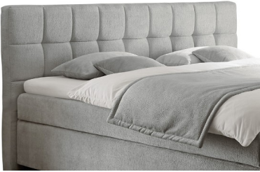
Kopfteil 1 (kürzbar) Stellmaßlänge ca. 210 cm Stellmaßbreite ca. Liegefl. + 11 cm Kopfteilhöhe ca. 111 cm