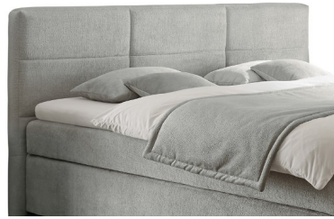
Kopfteil 2 (kürzbar) Stellmaßlänge ca. 210 cm Stellmaßbreite ca. Liegefl. + 11 cm Kopfteilhöhe ca. 111 cm