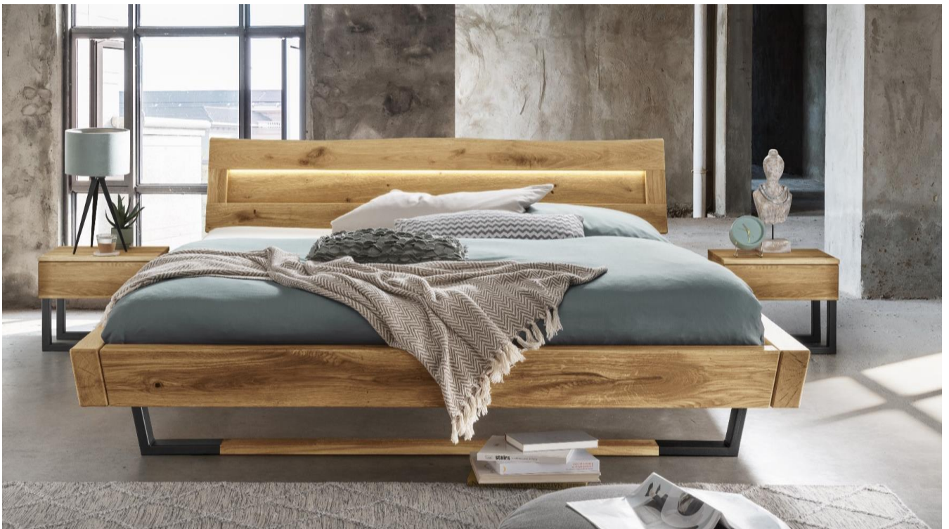
Balkenbett 817 Wildecke + Kiefer natur geölt