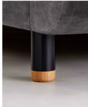
Holz- / Kunststofffuß Eiche schwarz