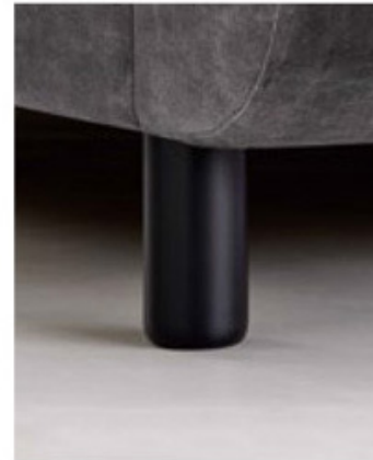
Kunststofffuß schwarz matt