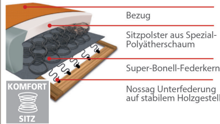
Komfortsitz mit Federkern