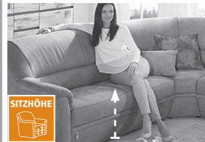
3 Sitzhöhen zur Auswahl

3 Sitzhöhen durch unterschiedlich hohe Möbelgleiter. Nicht möglich bei Funktionselementen. Dadurch ändert sich auch die Rückenhöhe.