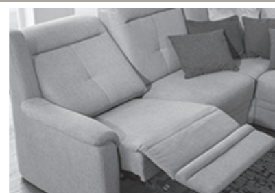
motorische Relaxfunktion (Mehrpreis, Kopfteilverstellung empfohlen)