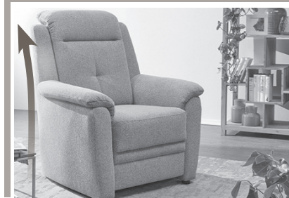
Extra hohe Rückenlehne