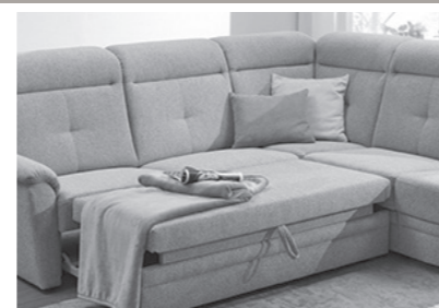
Querschläfer (Mehrpreis, Auszug ist optional im Originalbezug (echt) möglich)