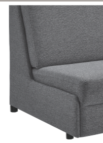
Abschlussblende alternativ zu einem Armteil möglich (Mehrpreis)