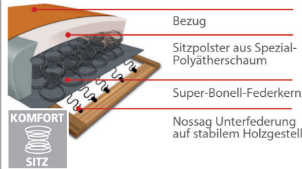
Komfortsitz mit Federkern