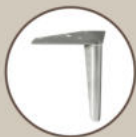
NNE black or alu

HEIGHT: 82 cm DEPTH: 95 cm SEAT DEPTH: 60 cm SEAT HEIGHT: 45 cm ARM HEIGHT: 65 cm