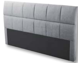
Kopfteil X025 H 112 x B 197 x T 13 cm