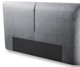
Kopfteil X022 H 130 x B 228 x T 18 cm