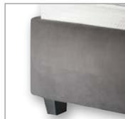
high, bodenfrei auf Fuß 10 cm