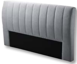
Kopfteil X004 H 110 x B 190 x T 20 cm

9 Kopfteile , preisgleich, Maßangaben in Höhe x Breite x Tiefe für Standardbreite von 180 cm