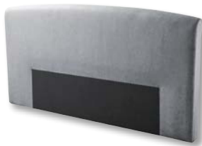
Kopfteil X028 H 116 x B 203 x T 16 cm