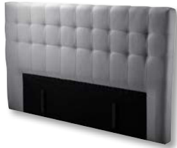
Kopfteil DBK4 H 123 x B 200 x T 14 cm