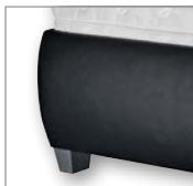
high, bodenfrei auf Fuß 10 cm