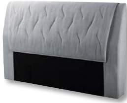
Kopfteil X011 H 120 x B 198 x T 20 cm