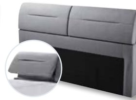
Kopfteil KTR8 mit Funktion H 113 x B 198 x T 20 cm Funktion bis Breite 140 cm durchgehend (1-tlg.)