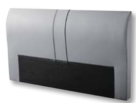
Kopfteil X026 H 113 x B 197 x T 17 cm