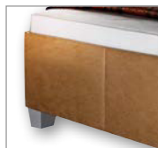
high, bodenfrei auf Fuß 10 cm