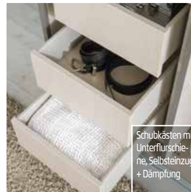
Schubkästen mit Unterflurschiene, Selbststeinzug + Dämpfung