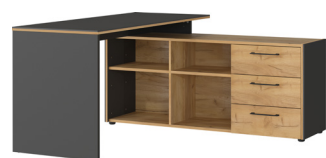
1621-549 B/H/T 147/75/145 cm

Winkelschreibtisch in Graphit/Navarra-Eiche-Nb., Melaminharzbeschichtung, Filigrane Dualkante, hochwertige ABS-Kanten, Selbsteinzug der Schubladen, Bügelgriffe aus Metall, Kunststoffmöbelgleiter in schwarz