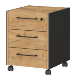
1569-549 B/H/T 42/54/49 cm

Rollcontainer in Graphit/Navarra-Eiche-Nb., Melaminharzbeschichtung, hochwertige ABS-Kanten, Schubladen mit Selbsteinzug, Filigrane Dualkante, Bügelgriffe aus Metall, Abschließbare Schublade, Laufrollen