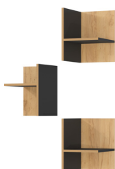
1619-549 B/H/T 27/37/35 cm

Facheinsätze 3er passend zu Aktenregal 1634 in Graphit/Navarra-Eiche-Nb., Melaminharzbeschichtung,