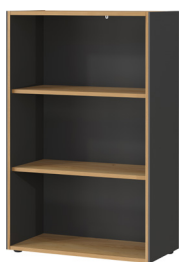
1634-549 B/H/T 75/120/40 cm

Aktenregal in Graphit/Navarra-Eiche-Nb., Melaminharzbeschichtung, hochwertige ABS-Kanten, Filigrane Dualkante, Kunststoffmöbelgleiter in schwarz