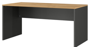
1587-549 B/H/T 158/75/79 cm

Schreibtisch in Graphit/Navarra-Eiche-Nb., Melaminharzbeschichtung, hochwertige ABS-Kanten,