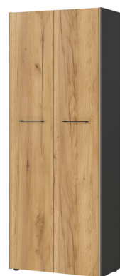
1649-549 B/H/T 75/196/40 cm

Aktenschrank in Graphit/Navarra-Eiche-Nb., Melaminharzbeschichtung, hochwertige ABS-Kanten, Filigrane Dualkante, Türdämpfung, Kunststoffmöbelgleiter in schwarz