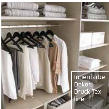
Innenfarbe Dekor-Druck Text-line