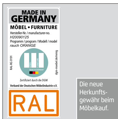
MADE IN GERMANY MÖBEL • FURNITURE Hersteller-Nr. / manufacture-no. H20090125 Programm / program / Modell / model rauch ORANGE