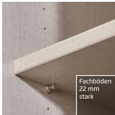
Fachböden 22 mm stark