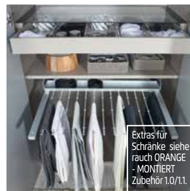
Extras für Schränke siehe rauch ORANGE - MONTIERT Zubehör 1.0/1.1.