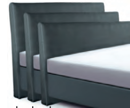
→ 1868S - Höhe 99 cm → 1868M - Höhe 109 cm → 1868L - Höhe 119 cm