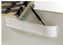
inkl. Luxus-Gasdruckfeder zum Öffnen des Lattenrahmens und Nutzung des Stauraums (nicht in Verbindung mit Motorlattenrahmen)