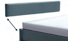
3124 Höhe 24 cm Kopfteil-Blende