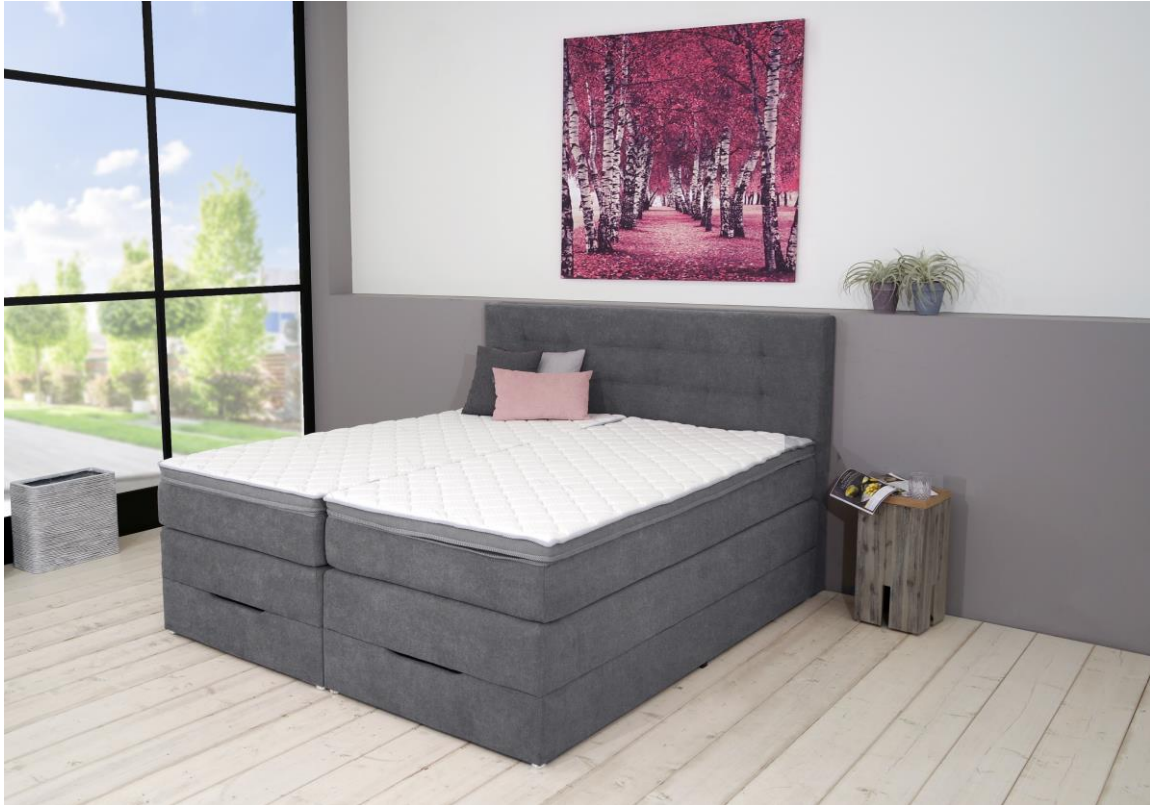
(Abb. ähnlich da Farbänderung)