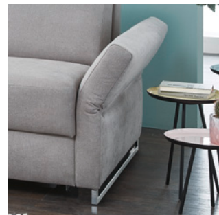
Typ 6 abklappbar