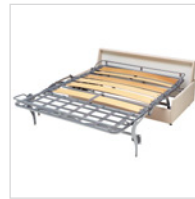
Ergoflex Lattenrost Standard