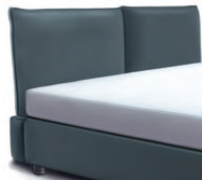
1857 Höhe 106 cm *