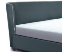
1871 Höhe 107 cm * inkl. Keder