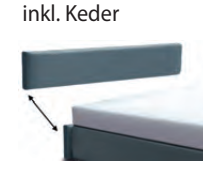
3124 Höhe 24 cm Kopfteil-Blende