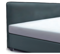
1869 Höhe 116 cm * inkl. Keder