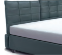
1858 Höhe 106 cm *