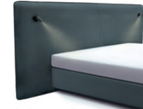
1867 Höhe 129 cm mit 2 Lampen schwarz inkl. Keder