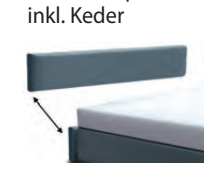
3124 Höhe 24 cm Kopfteil-Blende