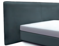
1867 Höhe 129 cm inkl. Keder