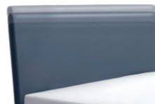
1300 Höhe 55 - 125 cm in 5 cm-Schritten kürzbar