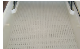
inkl. gelochter Bodenplatte für optimale Luftzirkulation