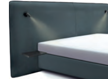
1867 Höhe 129 cm mit 2 Ablagetischen und 2 Lampen schwarz inkl. Keder