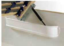
inkl. Luxus-Gasdruckfeder zum Öffnen des Lattenrahmens und Nutzung des Stauraums (nicht in Verbindung mit Motorlattenrahmen)