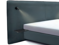
1867 Höhe 129 cm mit 2 Ablagetischen und 2 Lampen schwarz inkl. Keder