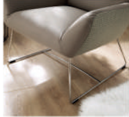
360 Drahtfuß Chrom glänzend