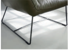
359 Drahtfuß schwarz matt