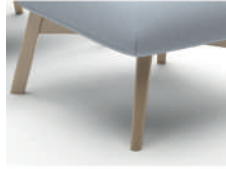
466 Holzfuß Eiche geölt