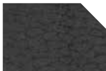
HERA braun 9808