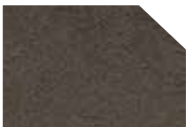
SCARLETT nougat 165