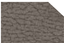
HERA taupe 3101