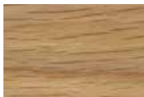
Eiche natur geölt