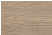
Eiche bianco geölt