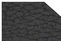
HERA anthrazit 3102