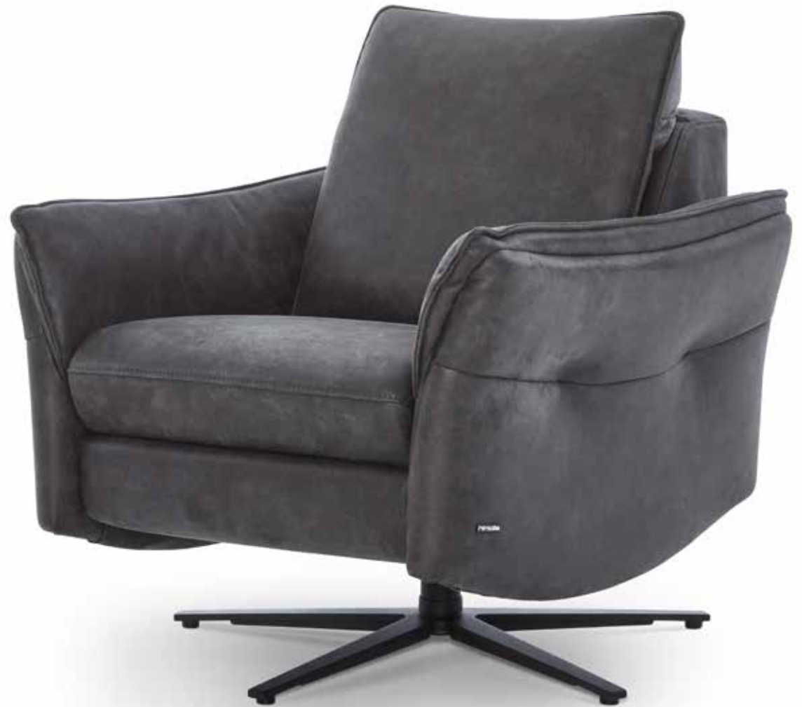
Bezug: 13 Nevada anthrazit