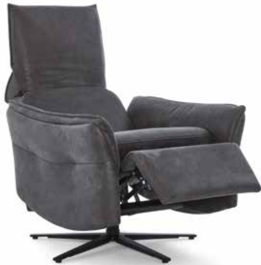
die Rückenlehne wird zur Kopf- stütze