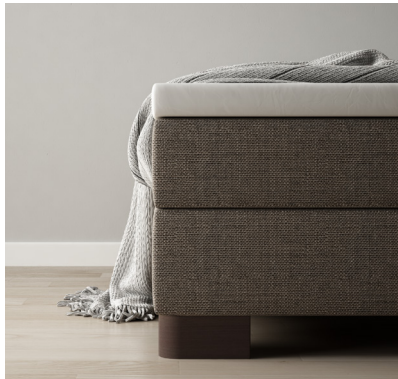
Robust Echtholz Wenge