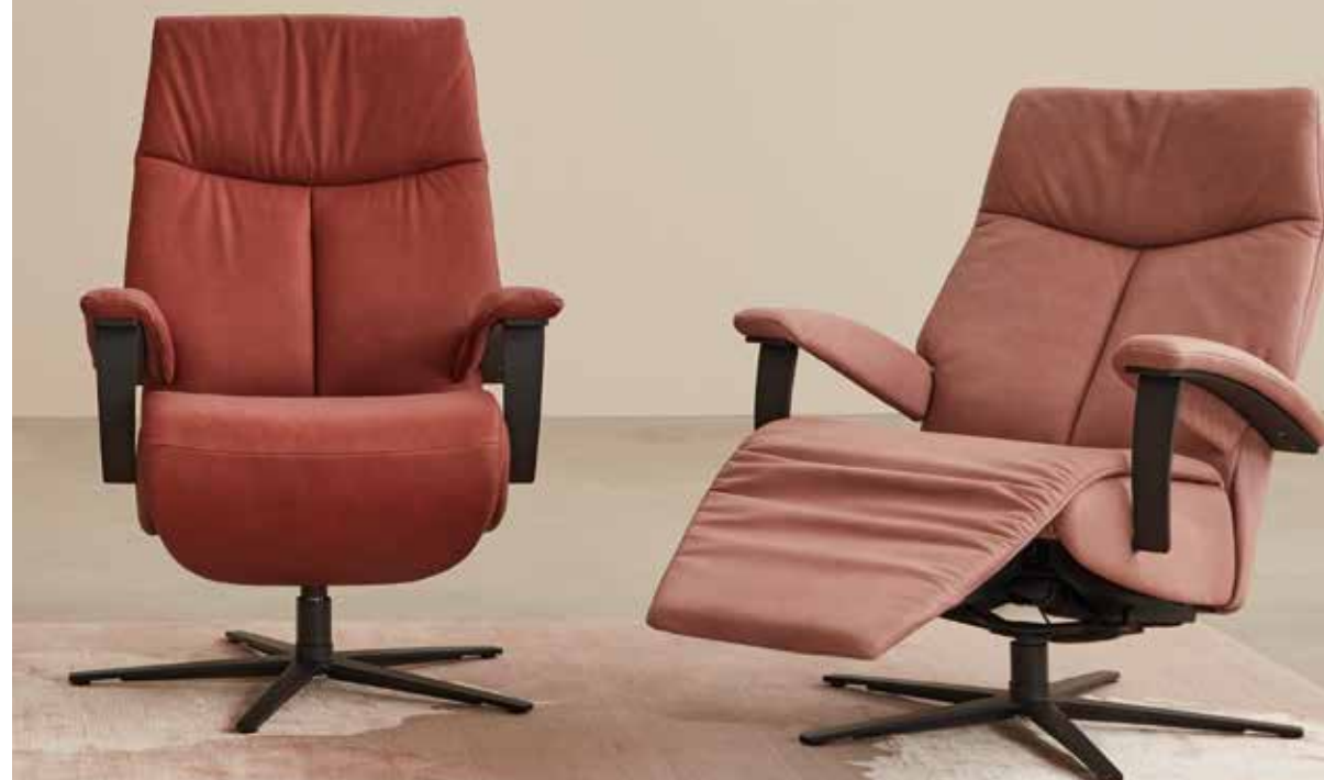
Bezug: 27 Leonessa piemont