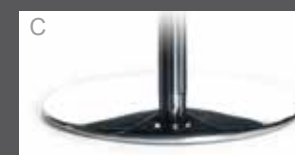
C Metallteller Chrom