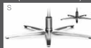
S Metall-Sternfuß schmal - verchromt - Edelstahloptik - Anthrazit (pulverbeschichtet)