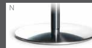
N Metallteller Edelstahloptik