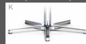
K Sternfuß Chrom