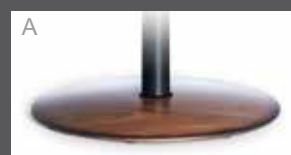
A Holzteller in Buche (Farbe lt. Beiztonkarte)