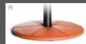
R Bezogener Teller (Leder oder Stoff)