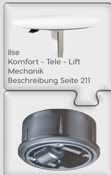
Ilse Komfort - Tele - Lift Mechanik Beschreibung Seite 211

Funktion Rollen Höhenverstellung Ilse - Lift - Mechanik Oberflächen 1 Größe 80 x 80 cm Höhe von Loungehöhe 39 bis Dininghöhe 76 cm durch Ilse - Tele - Lift - Mechanik stufenlos höhenverstellbar Platte HPL Marbel Grigio auf MDF mit unterschrittener Kante Gestell Säule in Anthrazit-Metalliceffekt lackiert Bodenplatte in Schliffoptik Anthrazit-Metalliceffekt lackiert auf Rollen