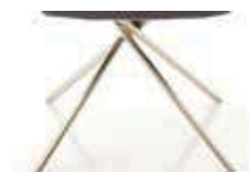
Ansicht Untergestell Stühle SAM, SM