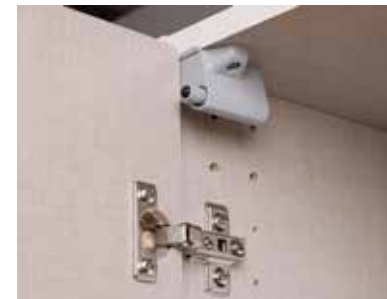
Topfbänder aus Metall, Drehtürendämpfer optional