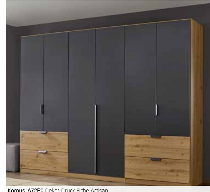
Korpus: A72P0 Dekor-Druck Eiche Artisan Front: A759W grau-metallic, Schubk. Dekor-Druck Eiche Artisan, Griffe/Griffstangen grau-metallic

■ Passende Extras rauch ORANGE - ZERLEGT Zubehör 1.0 finden Sie nach den Schränken.