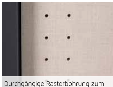
Durchgängige Rasterbohrung zum flexiblen Anordnen von Kleiderstange und Fachböden