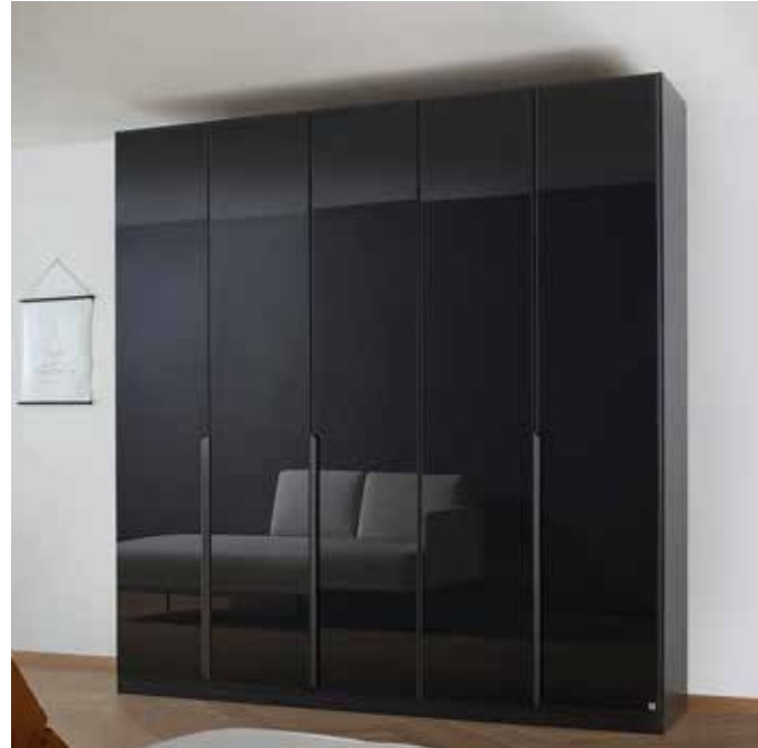
Korpus: A82P0 grau-metallic Front: A772W Glas basalt, Griffstangen grau-metallic