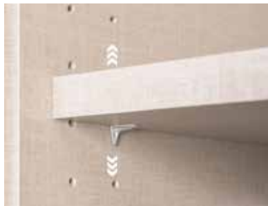
Fachböden 16 mm stark