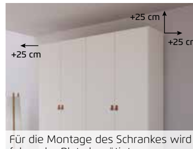
Für die Montage des Schrankes wird folgender Platz benötigt: Schrankschöhe + mind. 25 cm, Schrankbreite + mind. je 25 cm an beiden Seiten.