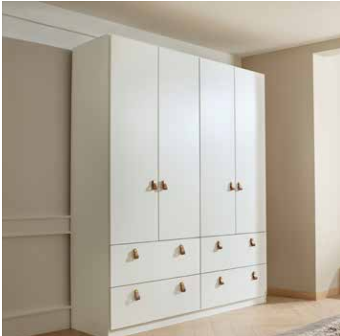
Korpus: A45P0 alpinweiß Front: A750P alpinweiß, Griffe Lederlasche