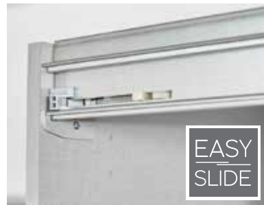
Führungsschienen aus Metall, Schwebetürendämpfer optional