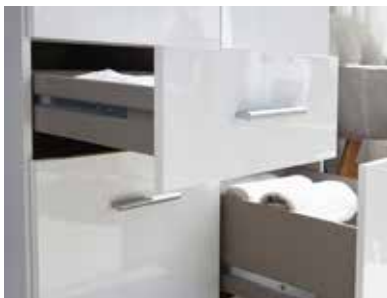
Schubkästen mit kugelgelagerten, leisen Laufschienen