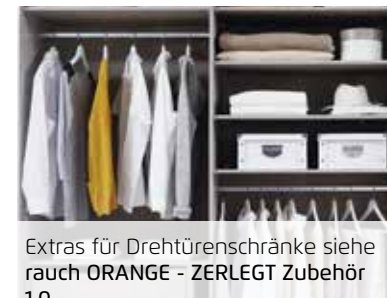
Extras für Drehtüreschränke siehe rauch ORANGE - ZERLEGT Zubehör 1.0. Extras für Schwebetüreschränke siehe rauch ORANGE - ZERLEGT Zubehör 1.1.