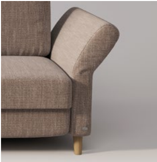
FLEX verstellbar mit Relaxfunktion

Vier verschiedene Seitenteile zur individuellen Gestaltung