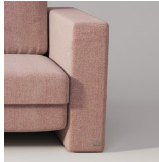
KUBUS geradlinig und markant