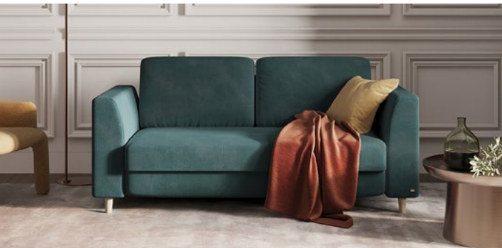
SOLUNA Trapez bei Tag