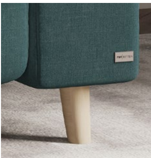
Standard Buche massiv (immer inklusive)

Vier Fußtypen zur Auswahl (bei Flex und Trapez)