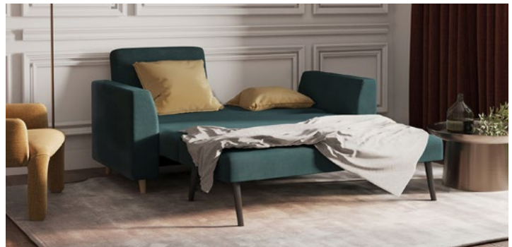
SOLUNA Trapez bei Nacht