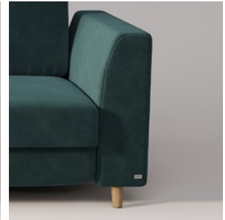
TRAPEZ ergonomisch und elegant