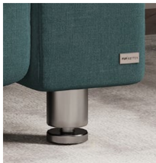
Fuß Z Metall Chrom