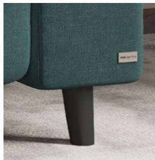
Fuß Y Holz schwarz