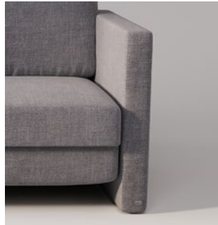
SCHMAL platzsparend und schlank