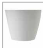
Kunststoffgleiter grau oder schwarz