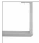
Metallkufe weiß M30 Mehrpreis