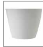
Kunststoffgleiter grau oder schwarz