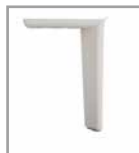
Metallfuß weiß M30