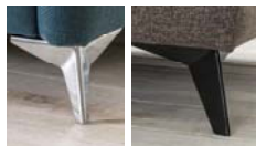
Detail 2: Metallfuss in chrom oder schwarz