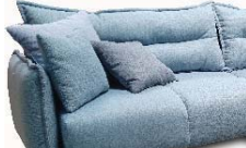
Detail 3: Legere-Softe Optik und Komfort mit modelltypischer Faltenbildung