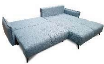
Detail 1: Schlaf Funktion mit Bettkasten