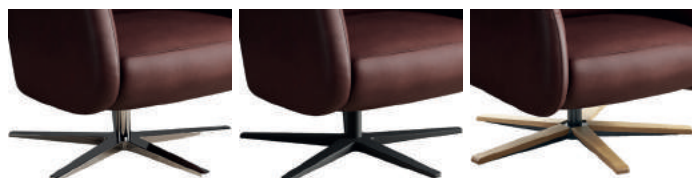
907 5-Sternfuß Aluminium glänzend

Bitte berücksichtigen Sie, dass der Konus bei der Auswahl des Holzfußes immer schwarz ist.