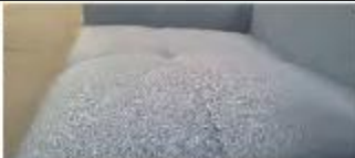
Detail 3: Legere, weiche Optik und Komfort mit modelltypischer Faltenbildung