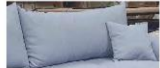
Detail 4: inklusive 2 Rückenkissen + 2 Zierkissen

Gestell: Tragende Teile aus massivem Hartholz, Verbindungen der tragenden Teile verdübelt oder verzapft, Spanplatte, Sperrholz