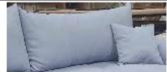
Detail 4: inklusive 2 Rückenkissen + 2 Zierkissen

Gestell: Tragende Teile aus massivem Hartholz, Verbindungen der tragenden Teile verdübelt oder verzapft, Spanplatte, Sperrholz