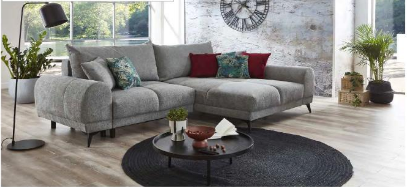
Bild: 2F BK (Li)-Rec (Re) Fuß Metall schwarz / Tula 12 mittelgrau (zusätzliche Zierkissen: Forest 3 grün + Monolith 69 burgund - nicht im Lieferumfang)

Schlaffunktion mit Bettkasten incl. 2 Rückenkissen + 2 Zierkissen in Polsterfarbe