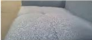
Detail 3: Legere, weiche Optik und Komfort mit modelltypischer Faltenbildung