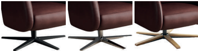
909 5-Sternfuß schwarz matt

Armlehne 1: Gesamtbreite ca. 11 cm Armlehne 4: Gesamtbreite ca. 15 cm