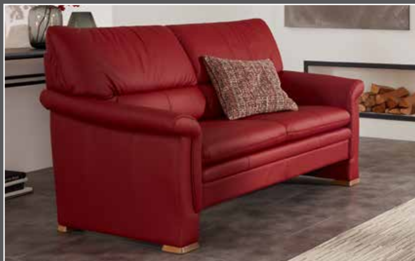
Variante 13 ohne Funktion