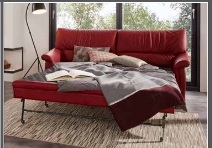
Variante 46 mit Bettfunktion