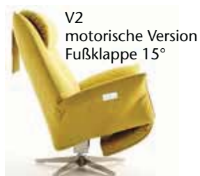
V2 motorische Version Fußklappe 15°