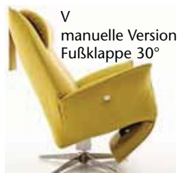
V manuelle Version Fußklappe 30°

Achtung: Das Fußteil der manuellen Funktion V ist nur dann ganz eingeschlagen (15°), wenn der Sessel „besessen“ wird, d.h. mit Körpergewicht belastet und ohne Belastung hat die Fußklappe einen Winkel von ca. 30° - zur Erleichterung der manuellen Auslösung.