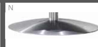
N Teller Edelstahl-Optik