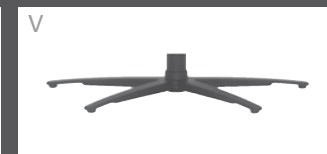
V Sternfuß pulverb. Anthrazit