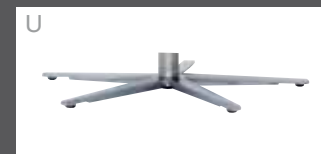
U Sternfuß Edelstahl-Optik