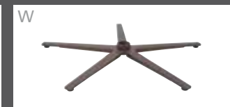
W Sternfuß pulverb. Bronze