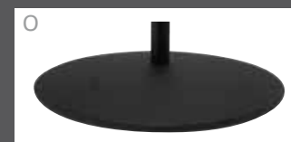
O Teller pulverbeschichtet Anthrazit