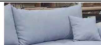
Detail 4: inklusive 2 Rückenkissen + 2 Zierkissen

Gestell: Tragende Teile aus massivem Hartholz, Verbindungen der tragenden Teile verdübelt oder verzapft, Spanplatte, Sperrholz