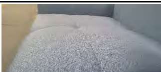
Detail 3: Legere, softe Optik und Komfort mit modelltypischer Faltenbildung