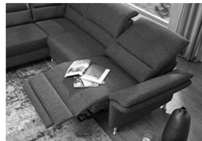
motorische Relaxfunktion wandfrei