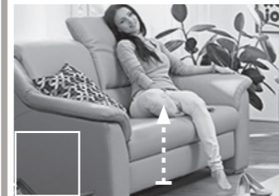
2 Sitzhöhen zur Auswahl