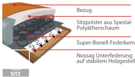
Komfortsitz mit Federkern