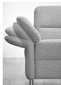
AT 4 - immer klappbar Mehrpreis