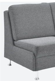
Abschlussblende alternativ zu einem Armteil möglich (Mehrpreis)