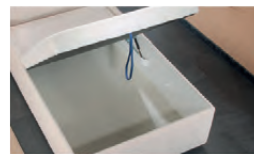
Großraumbettkasten durch aufklappbaren Lattenrahmen