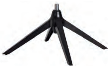
Drehschemel Schwarz matt für Typ -10/-11