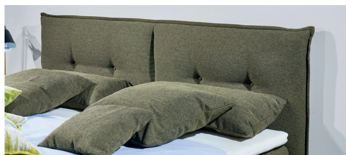
Kopfteil 3, Kissenoptik