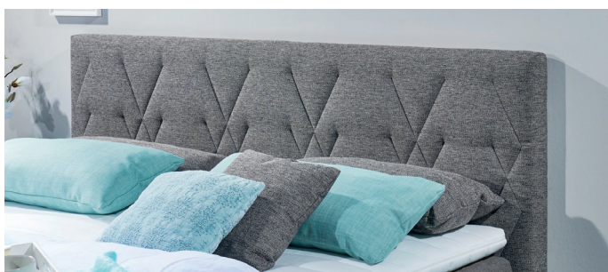
Kopfteil 2, Steppung Geometrie