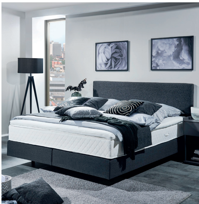
Kopfteil 1, glatt bezogen