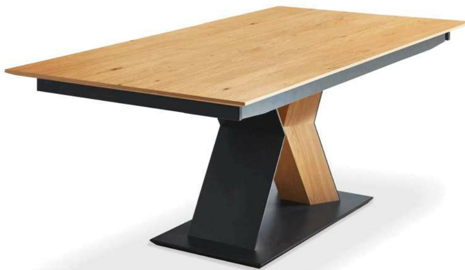
Abbildung 2E Funktionstisch Echtholz furnier Asteiche natur lackiert