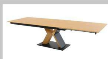
Tisch komplett ausgezogen