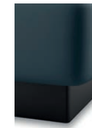
S 08-10 S 08-15 Bettsockel schwarz preisgleich nur für TFK classic