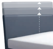
0300 Multimaß Höhe 55 - 125 cm in 5cm-Schritten kürzbar gegen Aufpreis