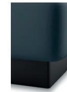
S 07-10 S 07-15 Bettsockel schwarz preisgleich nur für TFK modern