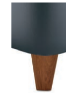
H 25-10 H 25-15 Holzfuß natur geölt preisgleich