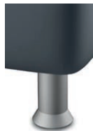
K 01-10 K 01-15 Kunststofffuß alufarbig Standard