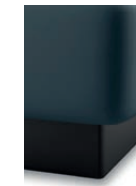
S 08-10 S 08-15 Bettsockel schwarz preisgleich nur für TFK classic