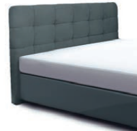
0830 Höhe 122cm preisgleich