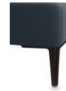
A 11-10/M01 A 11-15/M01 Alufuß schwarz preisgleich