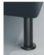
M 24-10 M 24-15 Metallfuß schwarz preisgleich