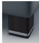
H 05-10 H 05-15 Holzfuß wengefarbig preisgleich