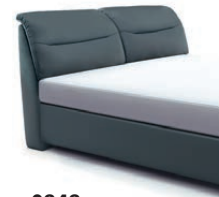
0848 Höhe 112cm preisgleich nur lieferbar bei Bettgrößen 160-200cm Breite