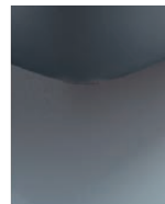
K08-10 K08-15 Schwebeoptik preisgleich