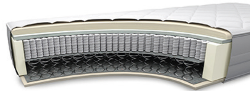
MA750VA gegen Aufpreis