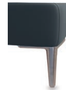
A 11-10/M12 A 11-15/M12 Alufuß gebürstet preisgleich