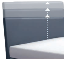
0300 Multimaß Höhe 55 - 125 cm in 5cm-Schritten kürzbar gegen Aufpreis