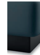
S 07-10 S 07-15 Bettsockel schwarz preisgleich nur für TFK modern