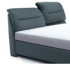
0848KV Höhe 112cm - 123cm gegen Aufpreis nur lieferbar bei Bettgrößen 160-200cm Breite