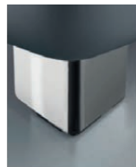
M 09-10 M 09-15 Metallfuß preisgleich