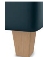
H 17-10 H 17-15 Holzfuß natur lackiert preisgleich