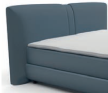
0314 Höhe 119 cm Standard