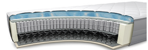
MA750GA gegen Aufpreis