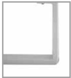
Metallkufe weiß M30 Mehrpreis