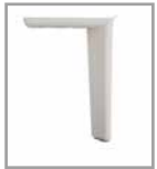
Metallfuß weiß M30