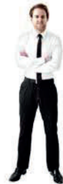
L ab ca. 183 cm

Konstruktiver Aufbau und gewählte Materialien gewährleisten, dass die Anforderungen der Güte & Prüfbestimmungen der RAL-GZ 430 erfüllt werden. Unsere Produkte sind ausgelegt für eine max. statische Belastung von 125 kg pro Sitzeinheit.