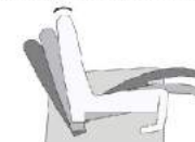
manuell und M1

Durch leichten Körperdruck senkt sich der Rücken und der Sitz geht automatisch nach vorn und oben. Eine Beinauflage fährt nach oben bis Sie in die Relaxposition gelangen. Das Kopfteil ist stufenlos verstellbar.