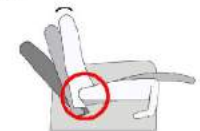
mit Comfort V und M2