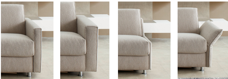
Armlehne Typ 1