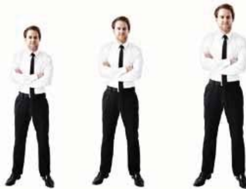
S bis ca. 165 cm M von ca. 165 bis 183 cm L ab ca. 183 cm

Der Sessel ist in jeder Ausführung in den 3 Größen S, M, L erhältlich. Alle relevanten Komfortgrößen (Sitzhöhe, Sitztiefe, Fußklappenlänge, Rückenhöhe) wachsen im Verhältnis mit, angepasst an alle Körpermaße.