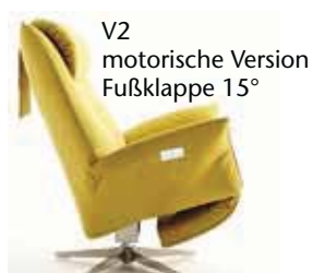
V2 motorische Version Fußklappe 15°