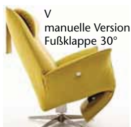
V manuelle Version Fußklappe 30°

Achtung: Das Fußteil der manuellen Funktion V ist nur dann ganz eingeschlagen (15°), wenn der Sessel „besessen“ wird, d.h. mit Körpergewicht belastet und ohne Belastung hat die Fußklappe einen Winkel von ca. 30° - zur Erleichterung der manuellen Auslösung.