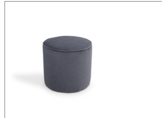
Circle Small Hocker