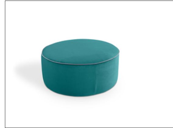
Circle Big Hocker