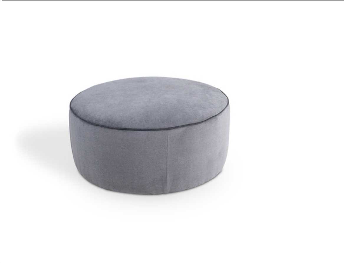
Circle Big Hocker