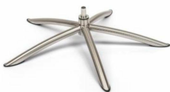
TS Tube Space Metall gebürstet (Gaslift-Höhenverstellungs-Option nicht möglich)