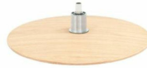
DBS Diskfuß Schwarz DBEO Diskfuß Eiche Geölt DBR3 Diskfuß Nuß Geölt DBEW Diskfuß Eiche weiß geölt DBE Diskfuß Eiche unbehandelt DBV3 Diskfuß Eiche geölt dunkel geräuchert