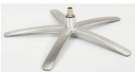
SB Sirius Base - Silver