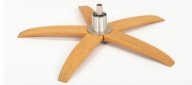
WSK Holzstern Fuß Schwarz WSG Holzstern Fuß Eiche Geölt WSR3 Holzstern Fuß Nuß Geölt WSM Holzstern Fuß Eiche weiß geölt WSH Holzstern Fuß Eiche unbehandelt WSV3 Holzstern Fuß Eiche geölt dunkel geräuchert