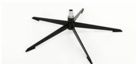
OSS Orion Base - Schwarz matt Für alle Fußvarianten Orion OSS Gaslift-Höhenverstellungs-Option möglich