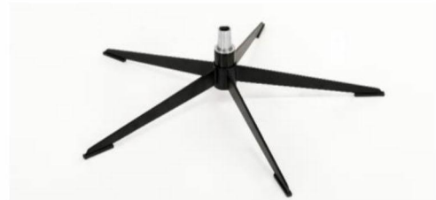
OSS Orion Base - Schwarz matt Für alle Fußvarianten Orion OSS Gaslift-Höhenverstellungs-Option möglich