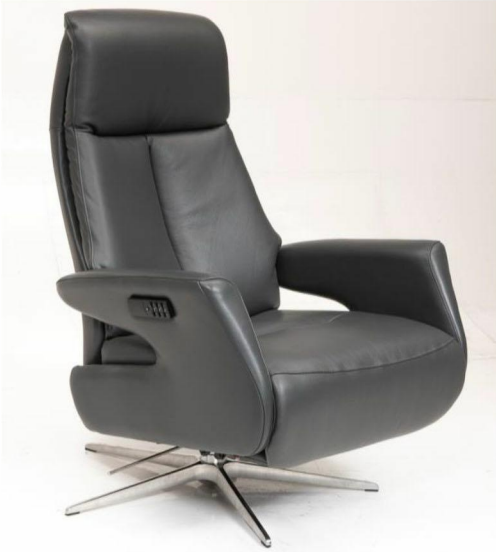
Schwarz Control-Panel 3-Motor-Sessel:

360° drehbarer 3-motorischer Relax-Sessel mit motorisch verstellbarer Rückenlehne, Fußstütze und Nackenstütze.