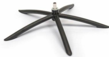
TSS2 Tube Space Metall Schwarz (Gaslift-Höhenverstellungs-Option nicht möglich)