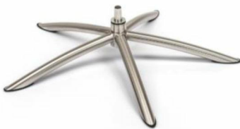
TS Tube Space Metall gebürstet (Gaslift-Höhenverstellungs-Option nicht möglich)