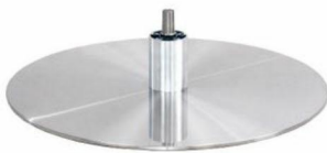
DBB Diskfuß - Metall gebürstet (Gaslift-Höhenverstellungs-Option nicht möglich)