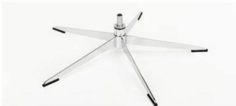
OS Orion Base - Chrom Für alle Fußvarianten Orion OS Gaslift-Höhenverstellungs-Option möglich