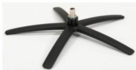
SB Sirius Base - Silver SBS Sirius Base - Schwarz