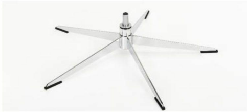
OS Orion Base - Chrom Für alle Fußvarianten Orion OS Gaslift-Höhenverstellungs-Option möglich