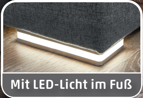
Mit LED-Licht im Fuß