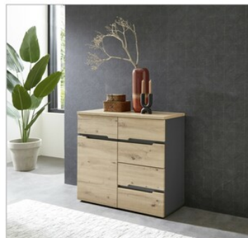
25 ca. 90/82/38 cm