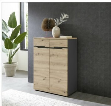
23 ca. 80/107/38 cm