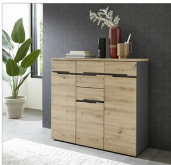
24 ca. 120/107/38 cm