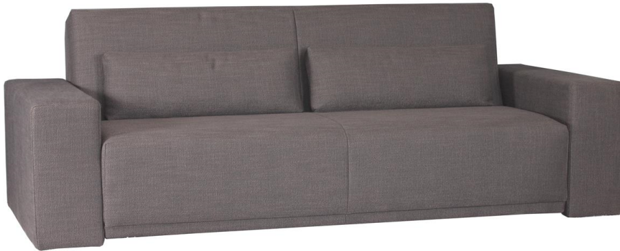
Abbildung: Bezug 40/4363 dunkelgrau